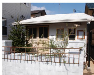
自宅の倉庫だった場所を改装した「Hug」。ぜひ遊びに来てください!