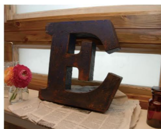
オススメの「アイアンアルファベット」。壁にかけることもできますよ!