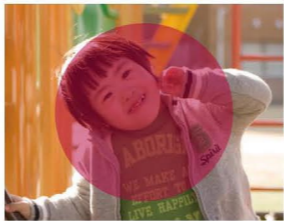
★日の丸構図 写真の主役が伝わりやすい構図。安定感がありますが、反面、平凡でインパクトに欠けてしまうことも。思いきってアップにすると、インパクトのある写真になります。