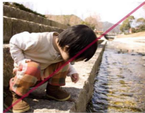
★対角線構図 空間的な奥行きを感じさせたい場面や、写真に動きを出したい時に効果的な構図。画面の中に斜め線を入れることで、緊張感や躍動感のある写真を生み出すことができます。