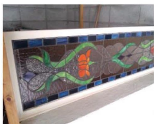
ブログ「hug's diary」には改装途中の写真も。チェックしてみてください!