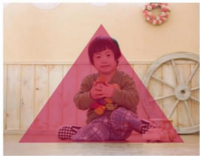
★三角構図 絵画にもよく用いられる基本的な構図。三角形に配置することで主題が強調され、伝えたいものがわかりやすくなります。静かで安定した画面となり、どしどしとした安心感を生み出します。