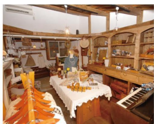
私の大好きなアンティークやレトロな雑貨も扱っています。

ながら、一人の人間として接していきたいと思えます。子どもが大きくなるにつれ、少しずつ手が離れていき、自分の時間は増えていくので、空いた時間を有効活用したいですね。仕事も家庭もバランスよく楽しめるよう、これからも感謝の気持ちを忘れずに、自分らしく歩んでいきたいと思えます。