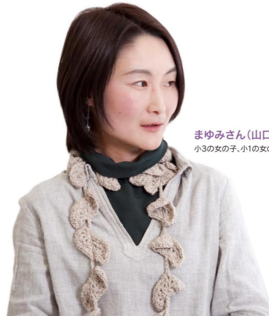
まゆみさん(山口県出身) 小3の女の子、小1の女の子のママ