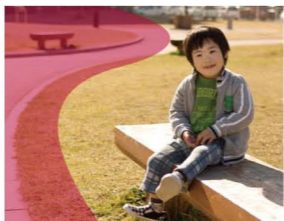
★S字構図 画面の中に曲線を取り込むことで、優雅なリズムや柔らかさを加えることができる構図。S字の曲線が、流れるような丸みのあるイメージを生み、風景や人物写真の背景に用いると奥行きが出ます。