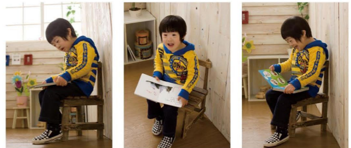
★ローアングル 小顔で足長の大人びた印象に。背景に空を入れたり空間的な広がりも演出できます。 ★ハイアングル 頭が大きく写り、子どもらしい体型が強調されます。かわいらしい魅力を引き出します。 ★アイレベル 子どもと同じ目線で、等身大の素直な雰囲気を取り取りまします。