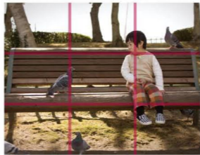
★3分割構図 名画にも多数見られ、最も美しいと言われる構図。上下左右に3分割した、交差点付近に撮りたい主役を配置します。デジカメのグリッド機能などを使うと、簡単にこの構図で撮影することができます。