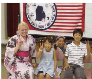
毎年、ホストファミリーとして留学生を受け入れています。

—— 子育てにおいては、3人の子もが社会に出るまで、きちんと育てることが私の仕事だと思っています。仕事に関しては、今は「子育てアドバイザー」を広めることが課題です。ママ友以上、おばあちゃん未満の存在、ママ姉として、皆さんにできる限りのサポートをしていきたいと思っています。