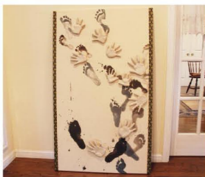
家族の手足をかたどったオブジェ。子どものたちの成長を感じます。