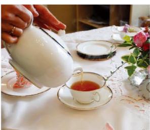
月3~4回開催している紅茶教室。紅茶はなくてはならない存在です!