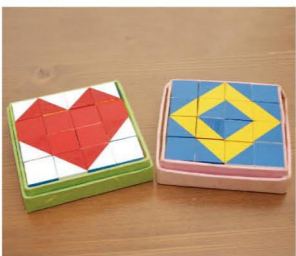
ニキーチンの積み木。これで遊ぶと算数ができる子になりますよ!