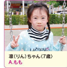
凜(りん)ちゃん(7歳) A.もも