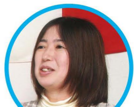
ふみえさん(石川県出身) [3歳の女の子のママ]