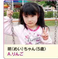
明(めい)ちゃん(5歳) A.りんご