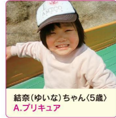
結奈(ゆいな)ちゃん(5歳) A.プリキュア