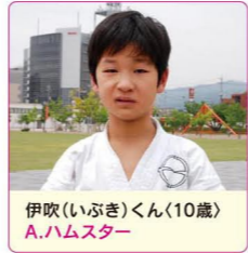
伊吹(いぶき)くん(10歳) A.ハムスター