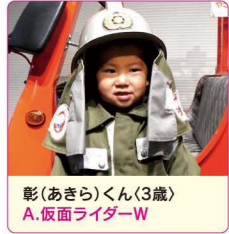
彰(あきら)くん(3歳) A.仮面ライダーW