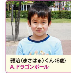
雅治(まさはる)くん(6歳) A.ドラゴンボール