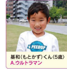
基和(もとかず)くん(5歳) A.ウルトラマン