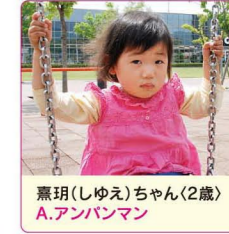
薫珮(しゆえ)ちゃん(2歳) A.アンパンマン