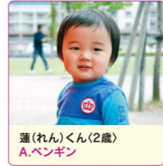
蓮(れん)くん(2歳) A.ペンギン