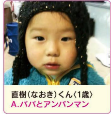
直樹(なおき)くん(1歳) A.パパとアンパンマン