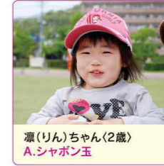
凜(りん)ちゃん(2歳) A.シャボン玉