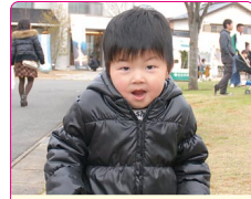
侅治(ゆうじ)くん(3歳) A.ウルトラマン