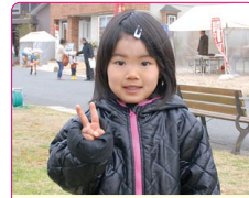
妃万里(ひまり)ちゃん(4歳) A.プリキュア