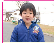
樹哉(みきや)くん(4歳) A.シンケンジャー