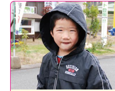
煌良(きら)くん(4歳) A.ゴセイジャー