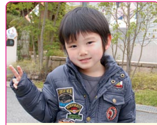
和弥(なごみ)くん(4歳) A.ウルトラマンゼロ