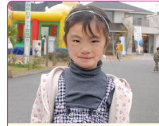
菜々子(ななこ)ちゃん(5歳) A.プリキュア