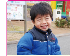
聖音(しおん)くん(3歳) A.シンケンジャー