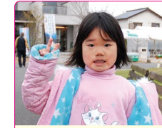
千佳(ちか)ちゃん(4歳) A.プリキュア