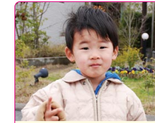
智也(ともや)くん(3歳) A.ゴセイジャー