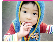
瑠生(るい)ちゃん(2歳) A.アンパンマン