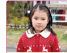
知彩(ちさ)ちゃん(5歳) A.プリキュア