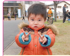
明典(あきのり)くん(3歳) A.シンケンジャー