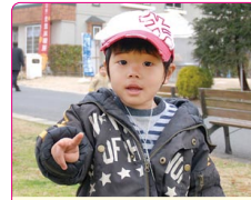
太生(たいせい)くん(2歳) A.シンケンジャー