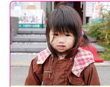
碧音(あおね)ちゃん(1歳) A.アンパンマン