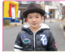
空(そら)くん(6歳) A.ゴセイジャー