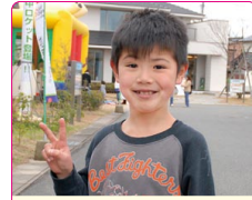
虎龍(たけろう)くん(8歳) A.ワンピース