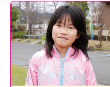
晴香(はるか)ちゃん(8歳) A.ジュエルペット