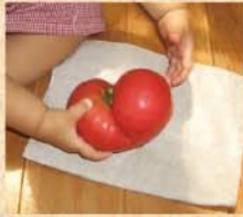
8月18日(火) 家庭菜園で収穫!! かわいいハート形に実ったトマトに思わず手が出ます。