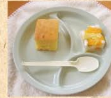
7月28日(火) 子育てサークルに参加。今日のおやつはフルーツ寒天と、ぐりとぐらのフライパンカステラ!!