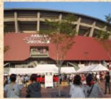
8月2日(日) マツダスタジアムへ! といってもクルマで前を素通り…ナイター観戦のお友達を送っただけでした。