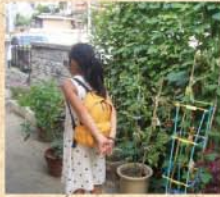
8月21日(金) 長女、お友達のおうちで初めてのお泊り。荷物もせ〜んぶ自分でつめたんだよ。行ってらっしゃ〜い!