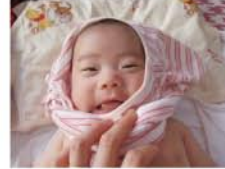
準グランプリ 【準グランプリ】 ベンネーム えびさくさん タイトル「お着替え中」 生後3ヶ月。首はまだ座っていませんが、いつもの風開きの服から、被って着るタイプの服に挑戦!! なかなかうまく着せられなくて、こぞっています。娘はとってモキゲンでした。

受賞された方には副賞を差し上げます。 副賞/オリジナルQUOカード 【グランプリ】 10,000円分 (2,000円券×5枚) 【準グランプリ】 2,500円分 (500円券×5枚)