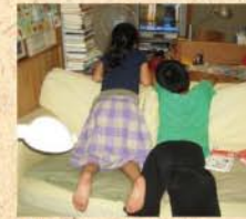
7月26日(日) 夏休み、あ〜なつやすみ…。つてダラけ過ぎな小学生達(怒) シャキッとせんかい!