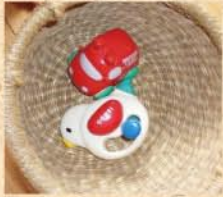
8月26日(水) 捨てモード全開! いらないものを処分してお部屋も心もスッキリ…のはずが、捨てられないおもちゃ。