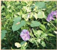
8月24日(月) 子どもたちが植えた朝顔。実はこれ2階の窓から撮影。どこまでものびていきます。