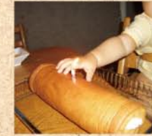
7月16日(木) おめでとう! 次女初めてのお誕生日にふさわしく一本菓子(ロールケーキ)でお祝いました。