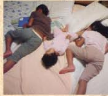
8月8日(土) きょうだいで「川」の字書いてます。両サイドの長男・長女の寝姿…ほほ同じ格好(笑)!