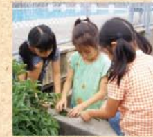
7月17日(金) 今も首も女の子3人よれば…なにやらかにやら楽しそう! 何を話しているのかな?