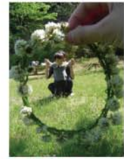
準グランプリ 【準グランプリ】 ベンネーム コアラさん タイトル「シロツメクサのトンネル?」