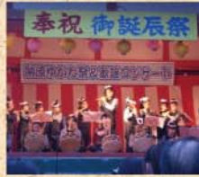
8月4日(火) 天満宮子どもお囃子隊? 「天神梅っ子」として長女の初ステージ! 格好だけはサマになります。