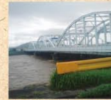
7月21日(火) 佐波川・新橋付近。橋桁に迫る勢いで増水! この前後、あちこちが大変な被害に遭いました…。