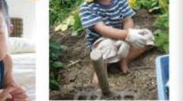
準グランプリ 5名様 【準グランプリ】 ベンネーム さくら☆さん タイトル「えへへ、たのしいな。」 家族でじゃがいもの収穫にきました。僕もしっかりお手伝い!!土を掘るのが一番楽しい。すっかり花巻にシロツメクサで花輪を作りました。初めて僕の飛行機に乗れてここに楽しいタイ旅行でした!