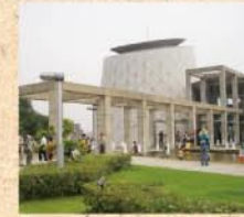
7月22日(水) ガラにもなく日食ブームにのって防府市青少年科学館ソラールへ。見上げたもんだ!