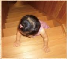
8月25日(火) お誕生日を過ぎて動きも活発になってきた次女。あつという間に階段も! あぶない、あぶない。