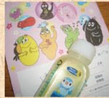
7月25日(土) 次女が“とびひ”治療。こ〜んなお薬ならよろこんで飲むかな!?