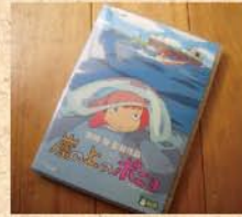
7月31日(金) 今さらながら長女は「ほ〜によほ〜によほ〜により」ローソンのCMにもしっかり反応してます!