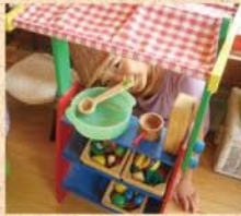
8月17日(月) 「いらっしやいませ〜」 本日おうちマルシェ OPEN!!