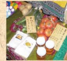
6月28日(日) 山口市・菜香亭で開催のフリーマーケットにお出かけ。こんな新鮮なお野菜も並んでました。