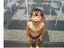
準グランプリ 【準グランプリ】 ベンネーム umeumeさん タイトル「水しぶき」 中央公園の噴水が大好きな娘。15分の水が出る時間を満喫中。