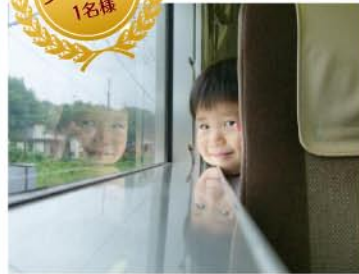
グランプリ 1名様 【グランプリ】 ベンネーム どうだんごさん タイトル「電車でおでかけ!」

何度か車で行った海苔館ですが、今回は電車でGO! 「うわー、トンネルがうごいてるよー!!」…君の方が動いて るんだよ。