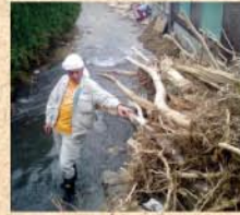
8月1日(土) パパが豪雨災害の復旧ボランティアに。川に見えるところ、実は道路! 想像を絶する被害に唖然…。