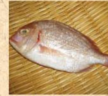
7月18日(土) めでたい! 次女のお祝いにおいたいただいた鯛の“尾頭付き”、今晚焼かれ、食卓に登場します。