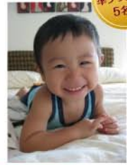
準グランプリ 【準グランプリ】 ベンネーム りかさくさん タイトル「にっこり^^」 初めて僕の飛行機に乗れてここに楽しいタイ旅行でした!