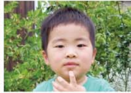
陸(りく)くん(4歳0ヶ月) A.魚 11