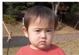
仁(じん)くん(1歳8ヶ月) A.はたらくるま 10