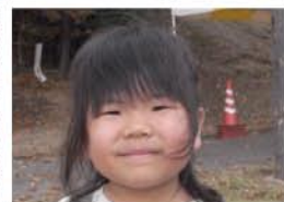
さらちゃん(4歳1ヶ月) A.わたしのワンピース 18