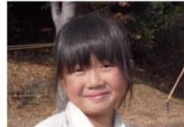
佳奈(かな)ちゃん(6歳6ヶ月) A.ノンタン 05