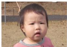
星来(せいら)ちゃん(1歳6ヶ月) A.アンパンマン 15