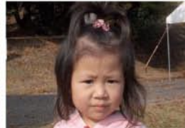
蕾(つぼみ)ちゃん(4歳0ヶ月) A.ことわざ絵本 09